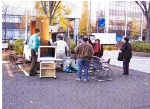
2002年11月の物品提供内覧会の様子

提供された物品を中古市場価格に換算すると約200万円の支援に相当する。前年度の提供分（約100万円）と合わせると、この2年間で約300万円相当の物品提供を行ってきたこととなる。団体事務所や事業拠点となる施設の開設など、NPOが事業を展開する際の初期コストは、NPOにとって大きな負担である。表のように、定期的にかつ大口の物品提供が行われていることで、システムを活用しているNPOは事業コストを大きく削減することができ、その波及効果は計り知れないものがある。